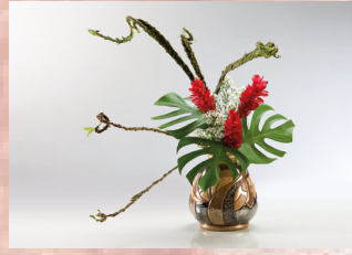
ESTAÇÃO LIBERDADE – 1 a 31 VITRINE DE IKEBANA Patrocínio: Yakult Realização: Metrô de São Paulo e Associação de Ikebana do Brasil