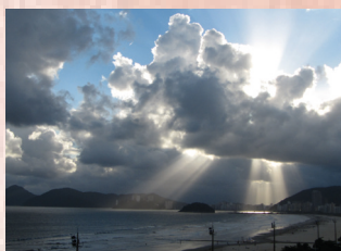
ESTAÇÃO PARAÍSO – 10 a 31 DA MINHA JANELA