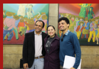
ESTAÇÃO MARECHAL DEODORO – dia 16 às 12 horas 10 MINUTOS DE ÓPERA Apoio: Metrô de São Paulo Parceria: Theatro São Pedro Realização: Instituto Pensarte