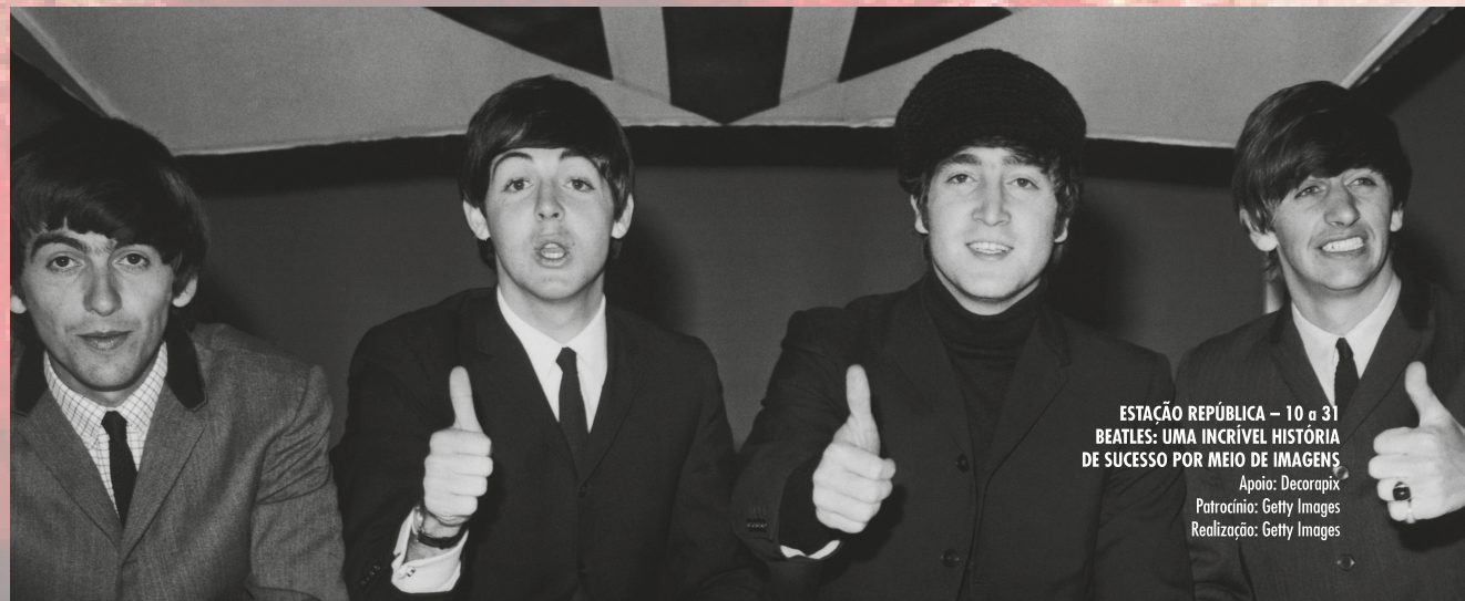
ESTAÇÃO REPÚBLICA – 10 a 31 BEATLES: UMA INCRÍVEL HISTÓRIA DE SUCESSO POR MEIO DE IMAGENS Apoio: Decorapix Patrocínio: Getty Images Realização: Getty Images