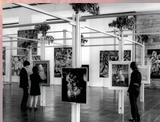
ESTAÇÃO TRIANON-MASP – VITRINES DO MASP – 4 a 31 ARQUIVO NO TRIANON-MASP Realização: Metrô de São Paulo e MASP Museu de Arte de São Paulo Assis Chateaubriand