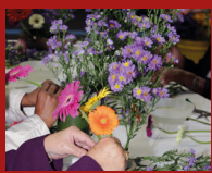
ESTAÇÃO CLÍNICAS – dia 18 – às 12 horas OFICINA DE IKEBANA Montagem de arranjo de Ikebana Patrocínio: Yakult Realização: Metrô de São Paulo e Associação de Ikebana do Brasil