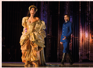
ESTAÇÃO MARECHAL DEODORO – 10 a 31 VITRINE DE FIGURINOS DE OPÉRAS Apoio: Metrô de São Paulo Parceria: Theatro São Pedro Realização: Instituto Pensarte www.pensarte.org.br