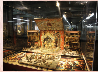
ESTAÇÃO TIRADENTES – 1 a 31 MUSEU DE ARTE SACRA – SALA METRÔ TIRADENTES EM BUSCA DO PRESEPIO UNIVERSAL Patrocínio: Banco Sinfra Realização: Governo do Estado de São Paulo Secretaria da Cultura / Secretaria dos Transportes Metropolitanos Museu de Arte Sacra / Associação Museu de Arte Sacra de São Paulo (SAMAS)