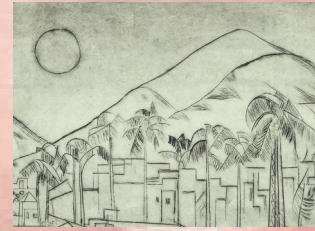
ESTAÇÃO SANTA CRUZ – VITRINE LASAR SEGALL – 4 a 31 LASAR SEGALL E O RIO Artista: Lasar Segall Realização: Metrô de São Paulo e Museu Lasar Segall