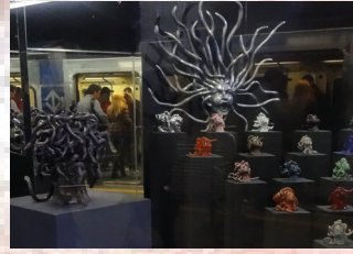
ESTAÇÃO SÃO BENTO – VITRINE SÃO BENTO – 1 a 31 MEDUSAS Artista: Lara Iglesias Curadoria: Oscar D'Ambrosio Produção Executiva: Fabio Galeazzo Realização: Cia Arte Cultura - www.ciaartecultura.com.br