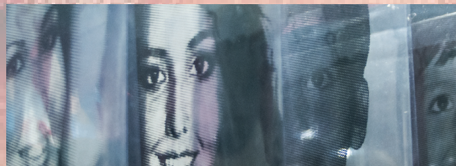
ESTAÇÃO REPÚBLICA – MUSEU DA DIVERSIDADE SEXUAL – 1 a 27 SONHAR O MUNDO – LIVRES E IGUAIS Curadoria: Paulo Van Poper e Márcio Zamboni Espografia: Hevan Cohen Apoio: ONU / OAB Diversidade / Defensoria Pública Exatomo: APAA / Museu da Diversidade Sexual Realização: Secretaria da Cultura do Estado de São Paulo