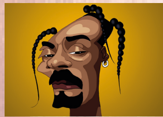
ESTAÇÃO SÉ – 10 a 31 NA LINHA DO HUMOR Site: www.saladodohumor.piracicaba.sp.gov.br Realização: Prefeitura Municipal de Piracicaba / Secretaria Municipal de Ação Cultural Centro Nacional de Humor Gráfico de Piracicaba