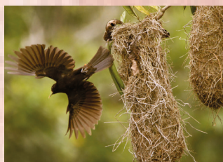
ESTAÇÃO SÃO BENTO – 10 a 31 AVES DA MATA ATLÂNTICA Patrocínio: Programa Patrocinador Socioambiental Realização: Agência Ambiental Pick-upou www.pick-upou.org.br

Apoio: Over 9k Patrocínio: Duloren Realização: ONG Rio de Paz