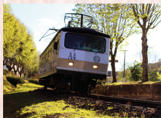
ESTAÇÃO REPÚBLICA – 10 a 31 ESTRADA DE FERRO CAMPOS DO JORDÃO Apoio: Metrô de São Paulo Realização: Secretaria dos Transportes Metropolitanos Estrada de Ferro Campos do Jordão