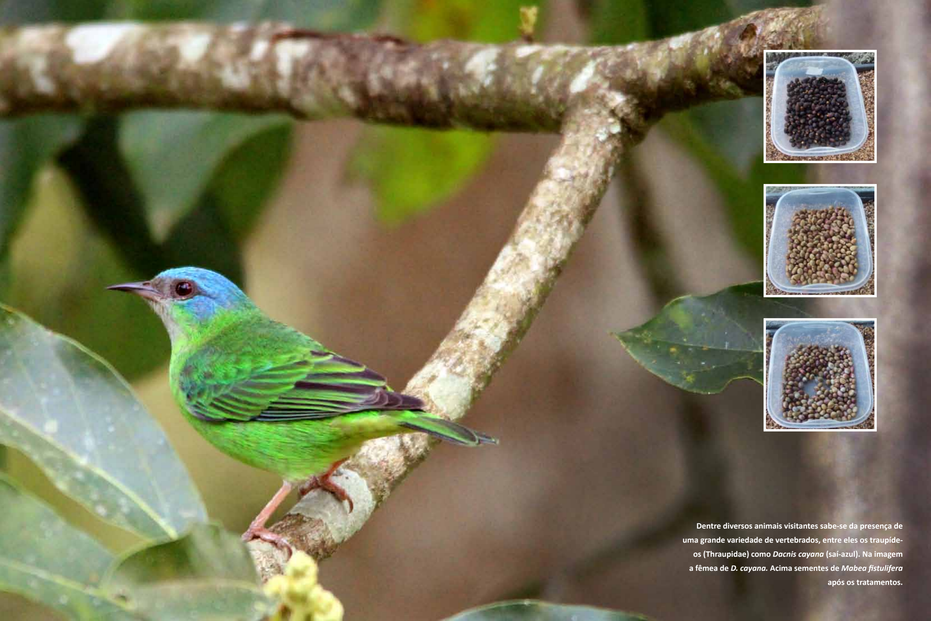
Dentre diversos animais visitantes sabe-se da presença de uma grande variedade de vertebrados, entre eles os traupídeos (Thraupidae) como Dacnis cayana (saí-azul). Na imagem a fêmea de D. cayana . Acima sementes de Mabea fistulifera após os tratamentos.