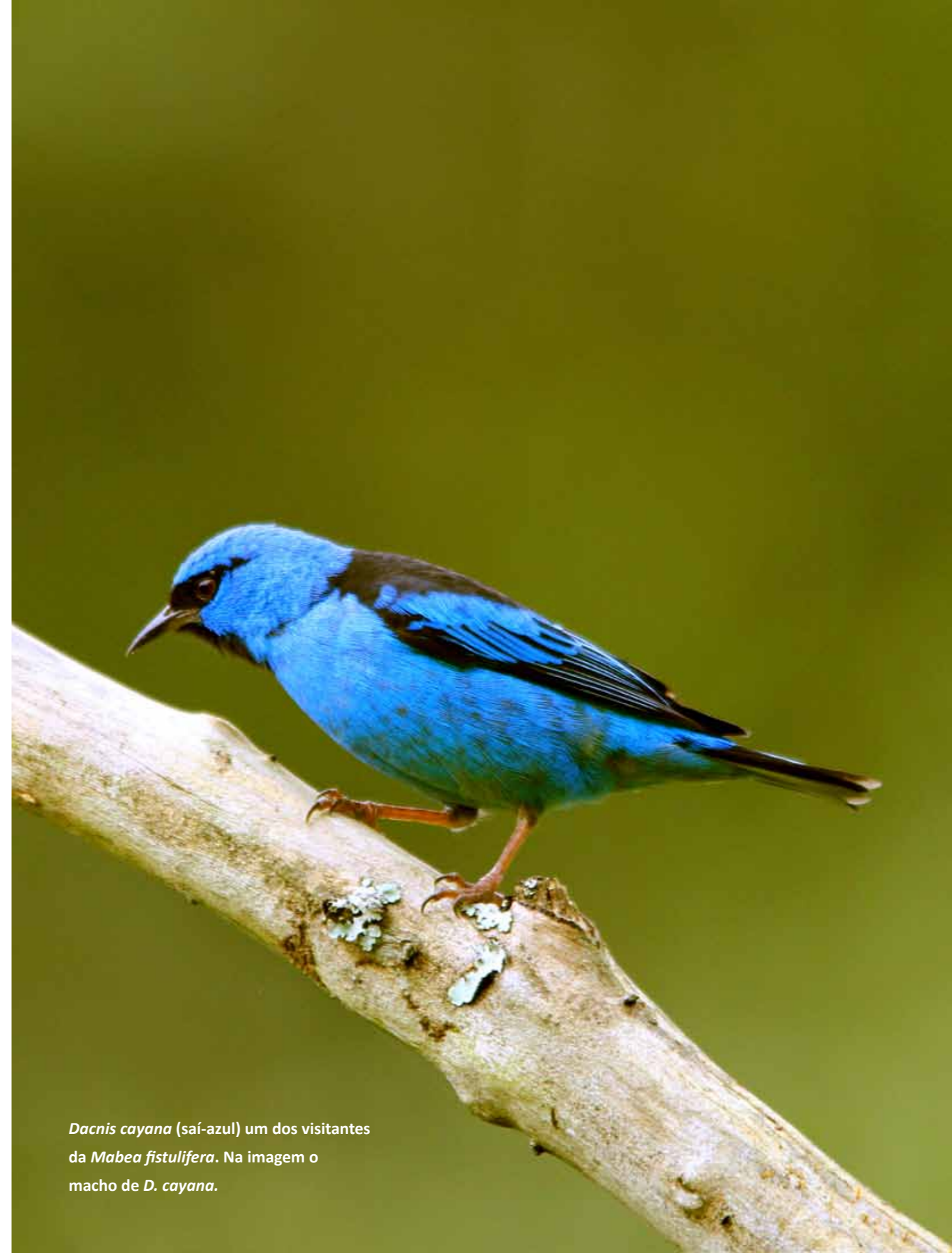
Dacnis cayana (saí-azul) um dos visitantes da Mabea fistulifera . Na imagem o macho de D. cayana .